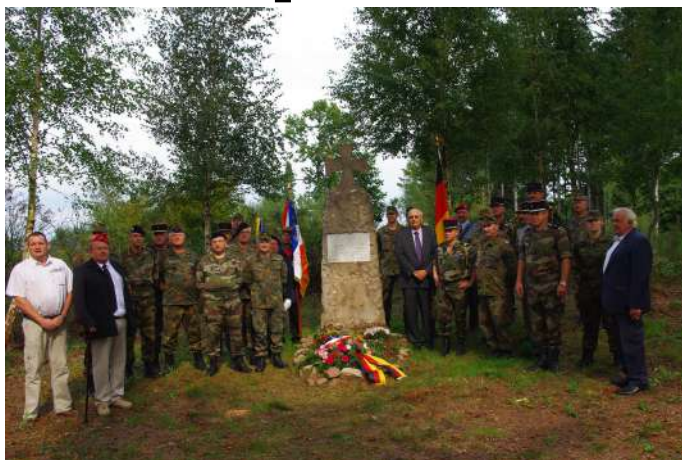
Commémoration Franco-allemande du 11 septembre 2011 des Lieutenants Wilhelm ROSCHOLL et Joachim von WICHMANN du 99ème régiment d'infanterie de Phalsbourg, organisée par L'association des Sous-Officiers de réserve Moselle-Sud