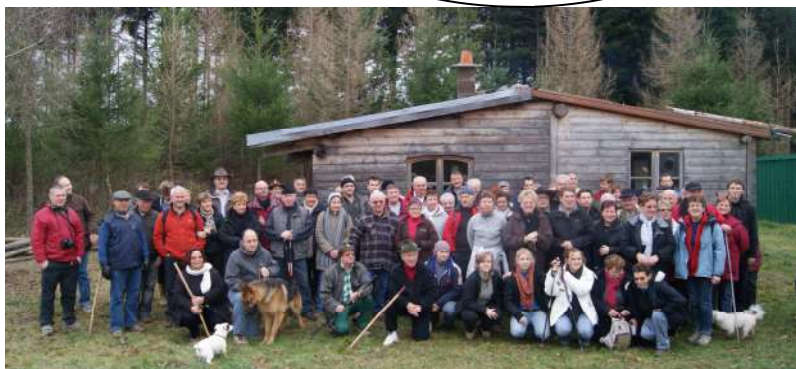
Marche de la St-Etienne