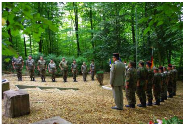
Cérémonie commémoration sur la tombe du Lieutenant Petermann