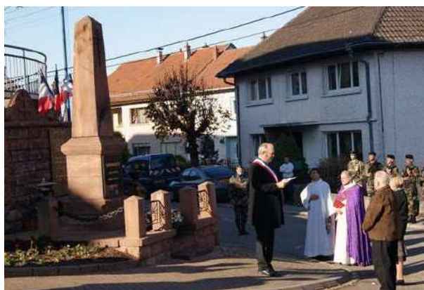
Cérémonie du 11 novembre à Biberkirch