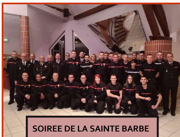
SOIREE DE LA SAINTE BARBE